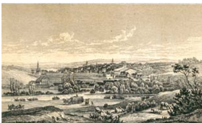
Ansicht von Marbach am Neckar aus der Oberamtsbeschreibung von 1866

Württemberg hat mit den ab 1824 erschienenen Oberamtsbeschreibungen, Maßstäbe gesetzt. Mit den Kreisbeschreibungen Crailsheim (1953) und Balingen (1960 mit fast 1.700 Seiten!) wurde die erfolgreiche, der wissenschaftlichen Tradition verpflichteten Reihe im neuen Land Baden-Württemberg fortgesetzt. Bedauerlicherweise konnten bis zur Einstellung der Reihe nicht für alle Landkreise entsprechende Beschreibungen veröffentlicht werden, so auch nicht für den Landkreis Ludwigsburg. Diese weißen Flächen in der Geschichtslandschaft sind schmerzlich. Mit freundlichen Grüßen Ihr Rolf Lutz